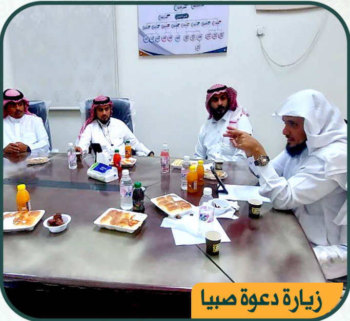
زيارة دعوة صبيا