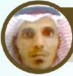
02 نائب الرئيس الشيخ إبراهيم عيسى أبو جرة